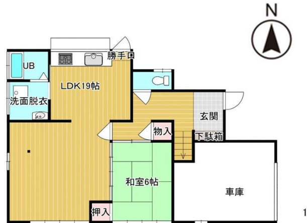
※図面と現況が異なる場合、現況優先します