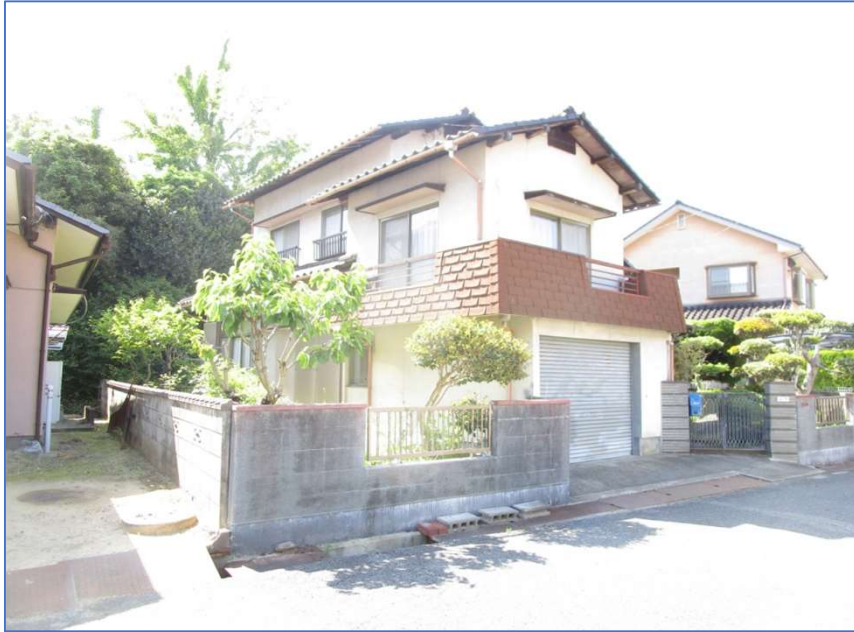
※リフォーム前写真